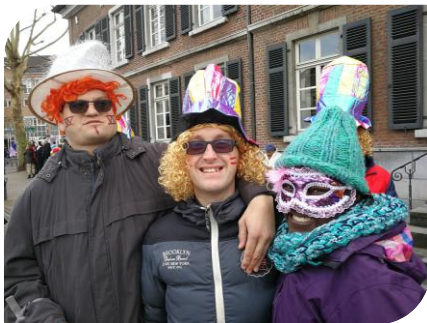
Carnaval de Stolberg (4 Mars 2019)

L' association, appelée « Amicale », se donne pour but complémentaire d'aider les personnes handicapées pour les diverses démarches que leur état les amène à entreprendre.